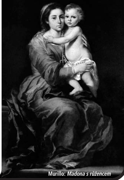
Murillo: Madona s růžencem